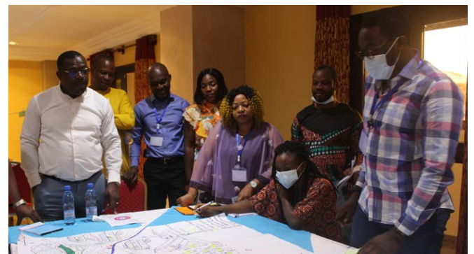
↑ Cartographie communautaire lors d'une session de formation de DIBC au Cameroun.

La FdF en ligne a lieu depuis plus de 12 mois. Tous les participants restent très impliqués et améliorent continuellement leurs compétences pour délivrer les modules de formation en ligne.