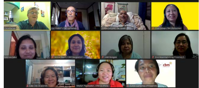
↑ Une session de formation en ligne de DIBC.

Participant à la formation en ligne du DIBC