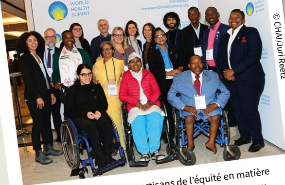
Ci-dessus : Défenseurs et partisans de l'équité en matière de santé pour les personnes en situation de handicap au Sommet Mondial de la Santé 2023 à Berlin.

Il reste encore beaucoup à faire. En 2024, les Nations Unies organisent le Sommet de l'Avenir, au cours duquel les États membres devraient se mettre d'accord sur un Pacte pour l'Avenir afin de faire progresser les ODD et de relever les défis mondiaux tels que la paix, le changement climatique et le financement durable. CBM est activement impliquée dans ce processus, en faisant des propositions orales et écrites et en participant à des initiatives de la société civile pour garantir la prise en compte des droits des personnes en situation de handicap dans le Pacte.