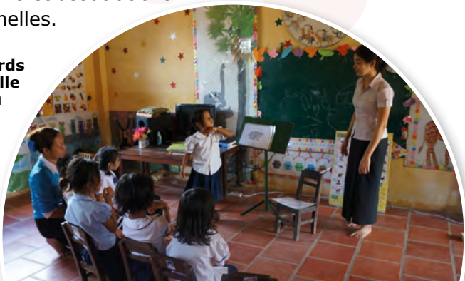
Enfants sourds dans une salle de classe au Cambodge

CBM collabore avec des partenaires aux niveaux local, national, régional et mondial en apportant un soutien technique et financier et en s'engageant dans l'établissement d'alliances et dans le plaidoyer. Ses partenaires au niveau mondial sont entre autres l'IDA (International Disability Alliance), l'IDDC (International Disability and Development Consortium), l'OMS (Organisation Mondiale de la Santé), l'ONU (Organisation des Nations Unies), et des organisations et associations professionnelles.