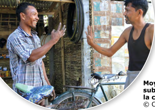
Moyens de subsistance dans la communauté